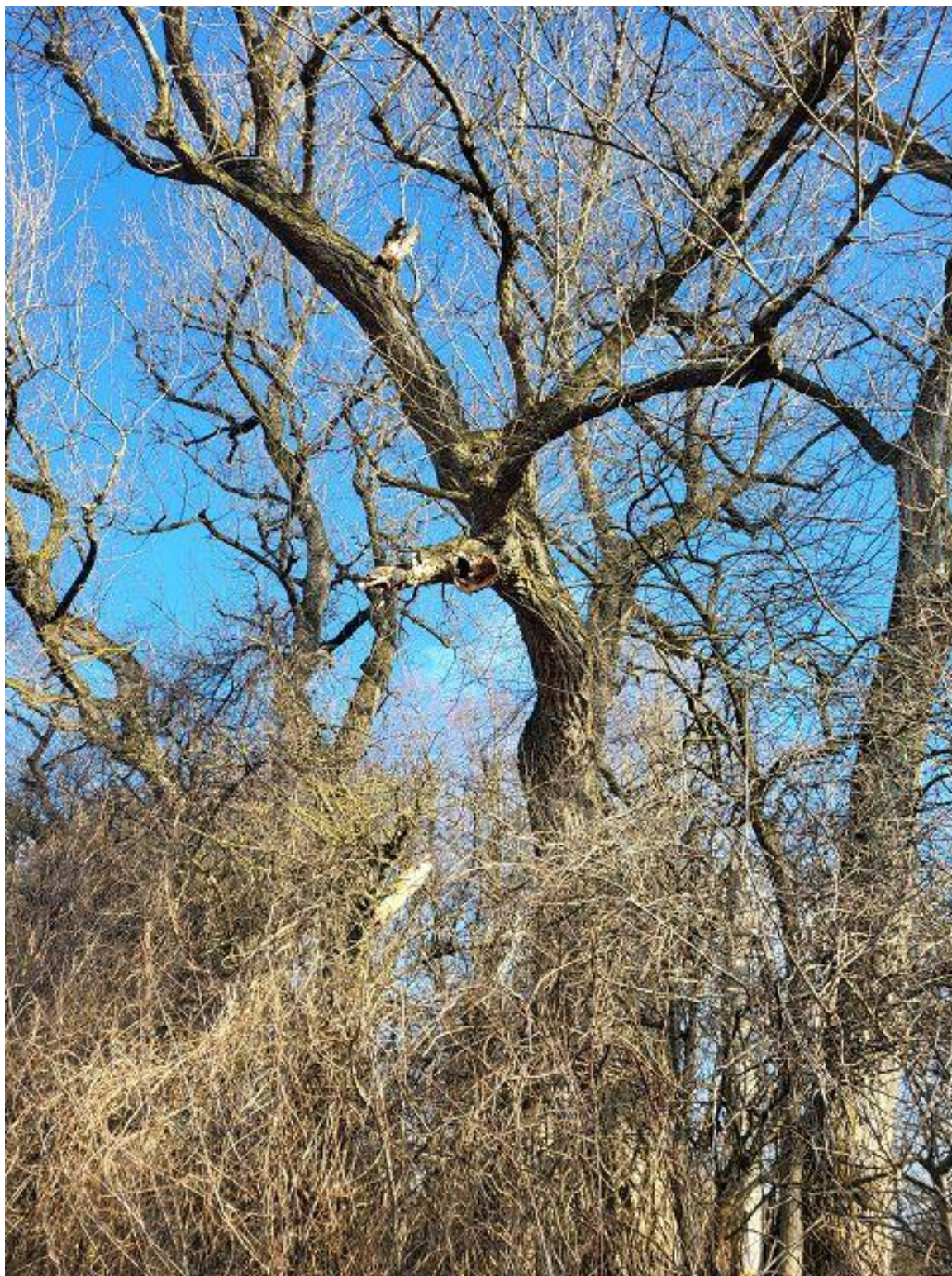
Abb. 3 Baum Nr. 482, Pappel