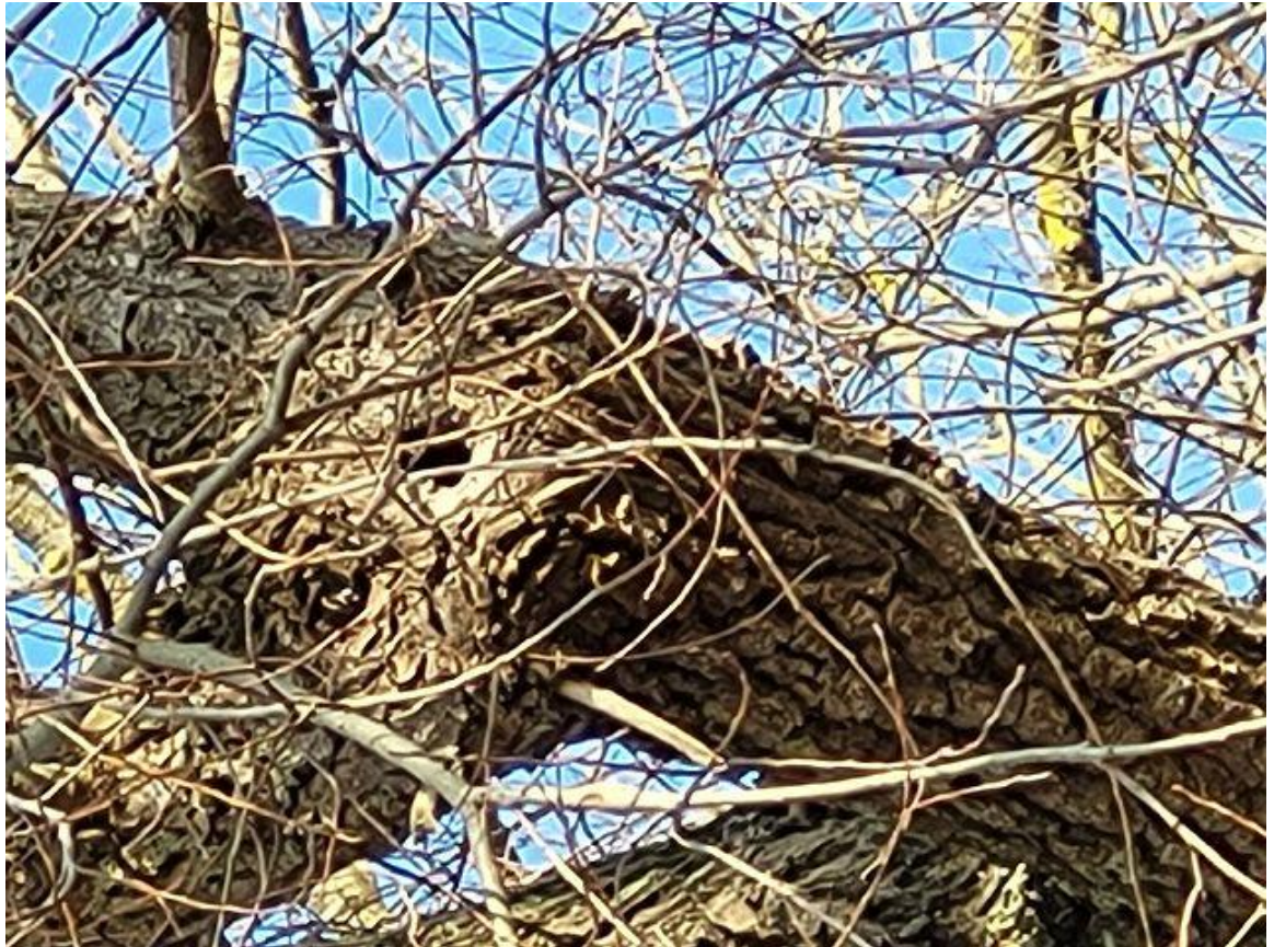
Abb. 8 Baum Nr. 554, Silberweide, Astabbruch