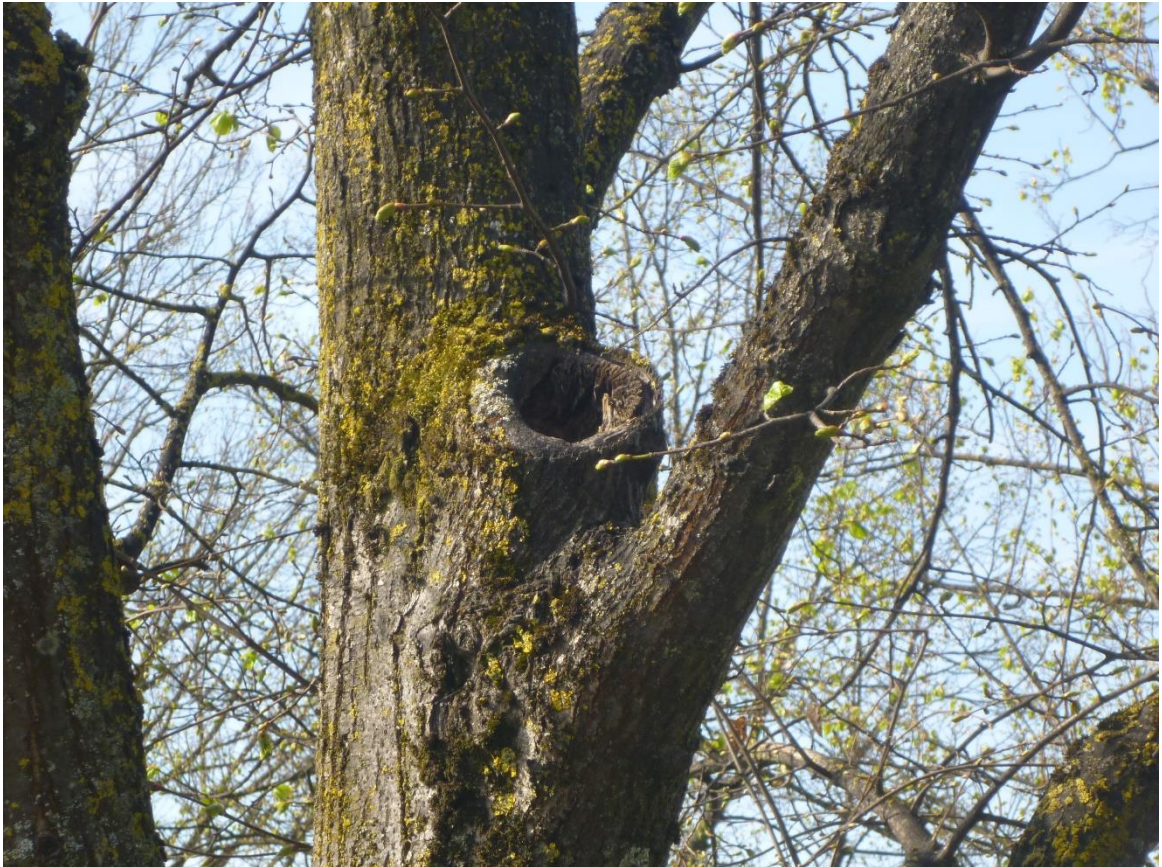
Abb. 2 Baum Nr. 124, Winterlinde mit Astabbruch