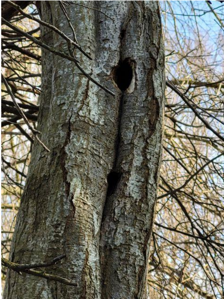
Abb. 5 Baum Nr. 524, Grauerle