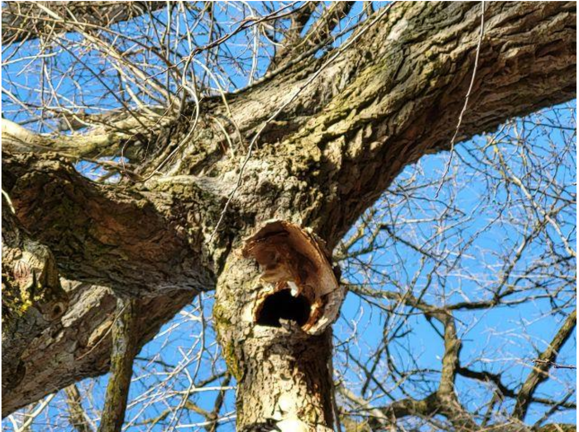
Abb. 4 Baum Nr. 482, Pappel, Abbruch Seitenast und waagrechter Reststumpf