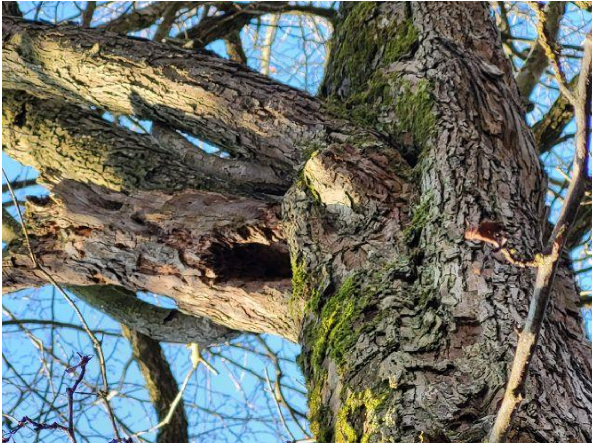
Abb. 6 Baum Nr. 525, Weißdorn, abgestorbener Seitenast