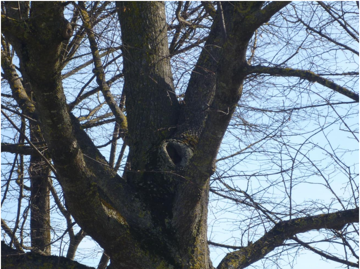
Abb. 1 Baum Nr. 97, Winterlinde mit Astabbruch