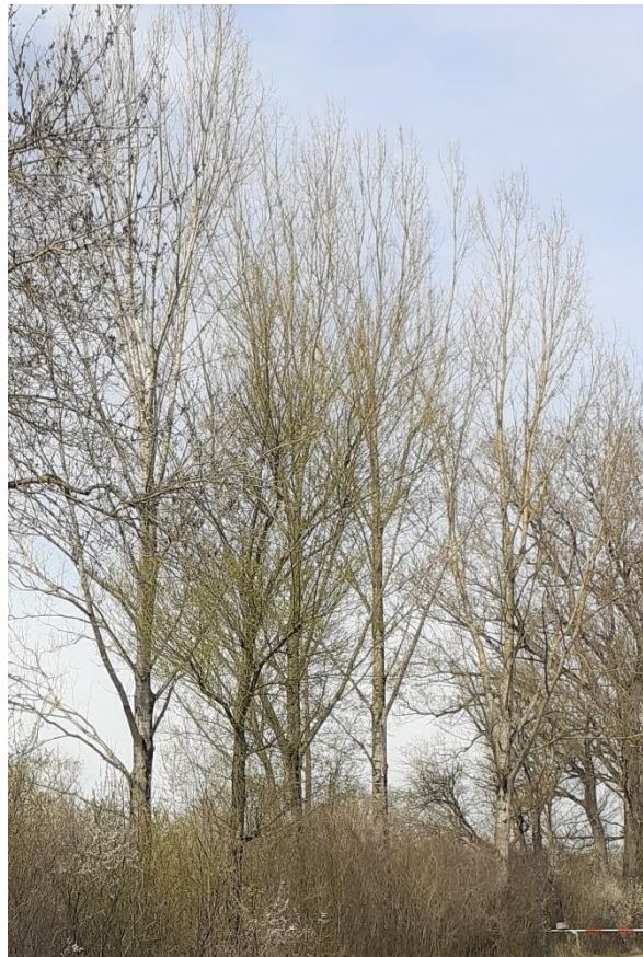
Baum Nr. 414 ff: Pappeln