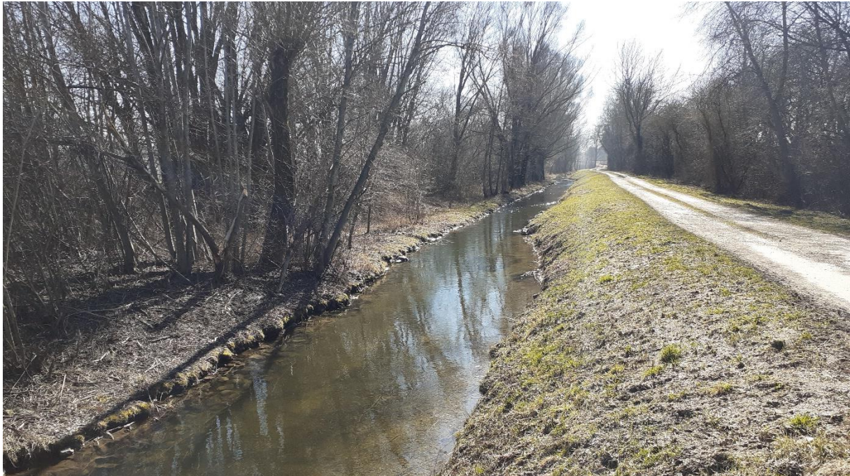
Ludwigskanal (südlich Freisinger Allee) von N nach S: links Uferberme / Grabentaschen mit B112-WN00BK, rechts vom Feldweg Feldhecke B112-WH00BK