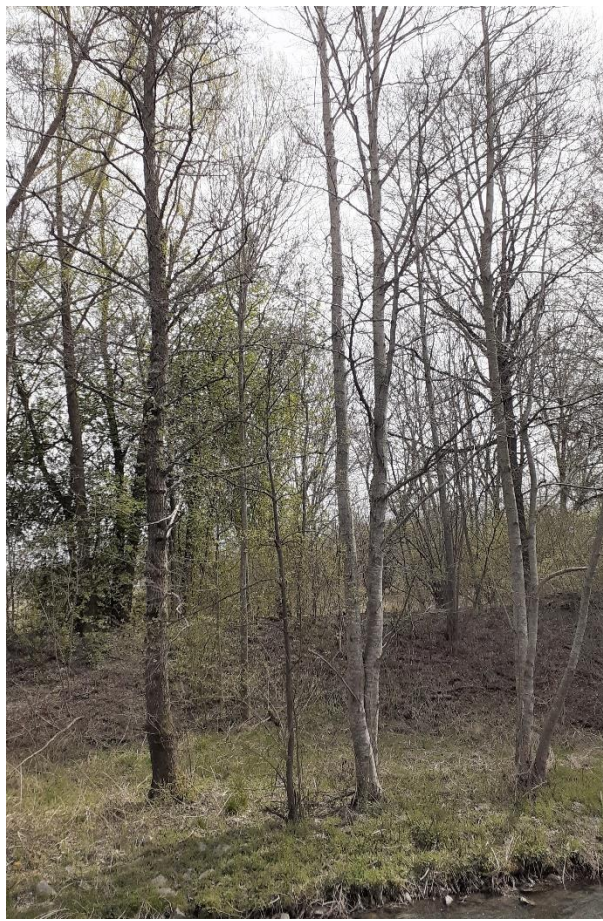
Bäume Nr. 575-577: li Schwarzerle, rechts Grauerlen