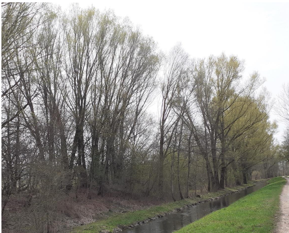
Ludwigskanal: markante Silberweiden