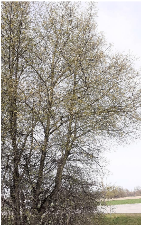
Baum Nr. 533: Traubenkirsche