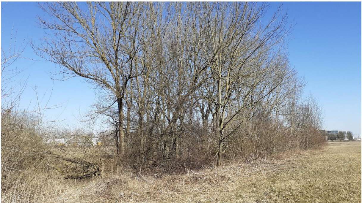
Weiteres Feldgehölz rechts des Ludwigskanals (50 m weiter nördlich)