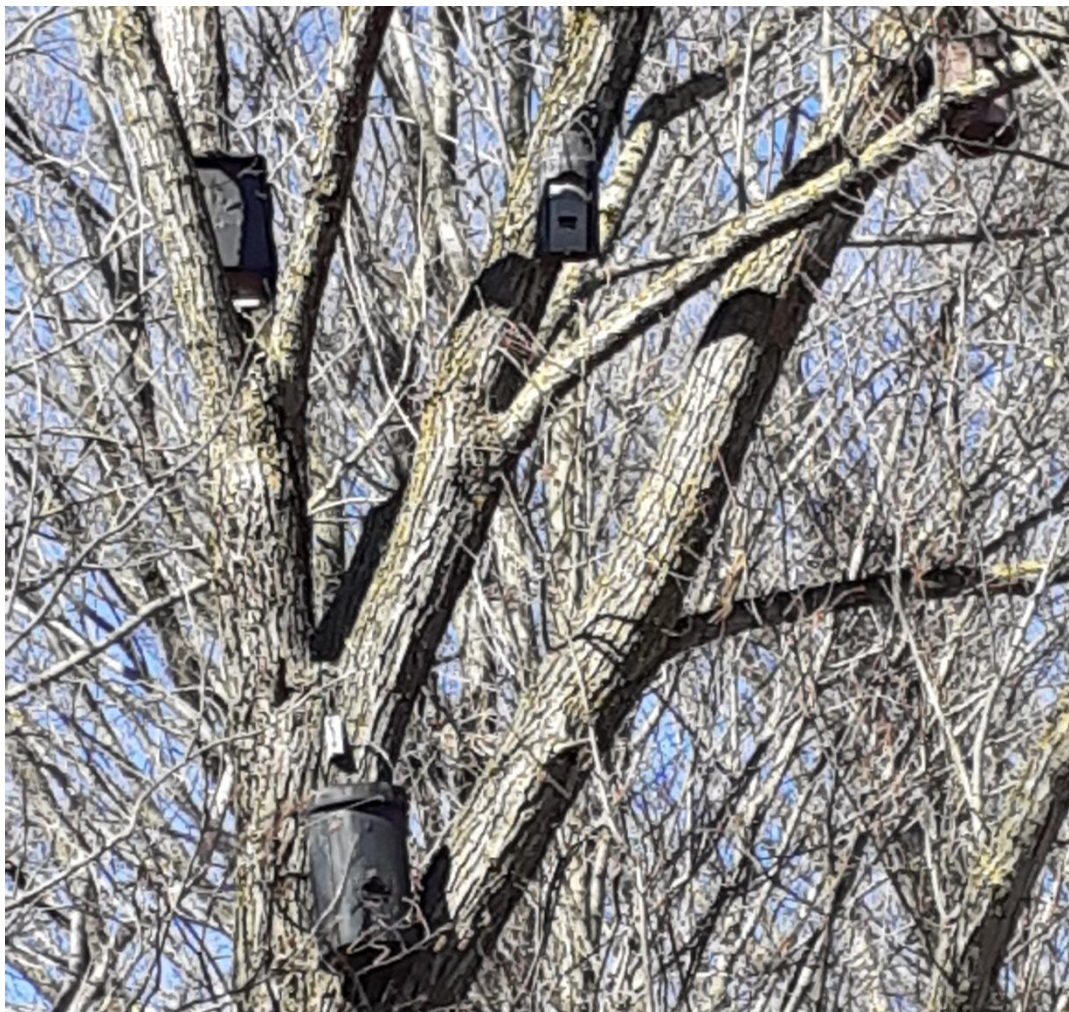
Baum rechts des Ludwigskanals mit vier künstlichen Habitaten (Fledermaushöhlen)