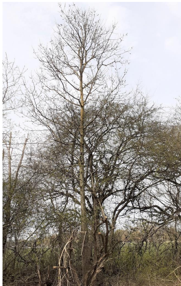
Baum Nr. 519: Esche (im Vordergrund)