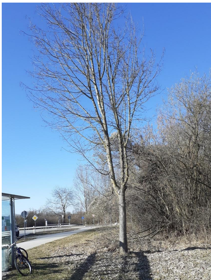
Solitärbaum und Gebüsch bei Bushaltestelle östlich der Freisinger Allee.