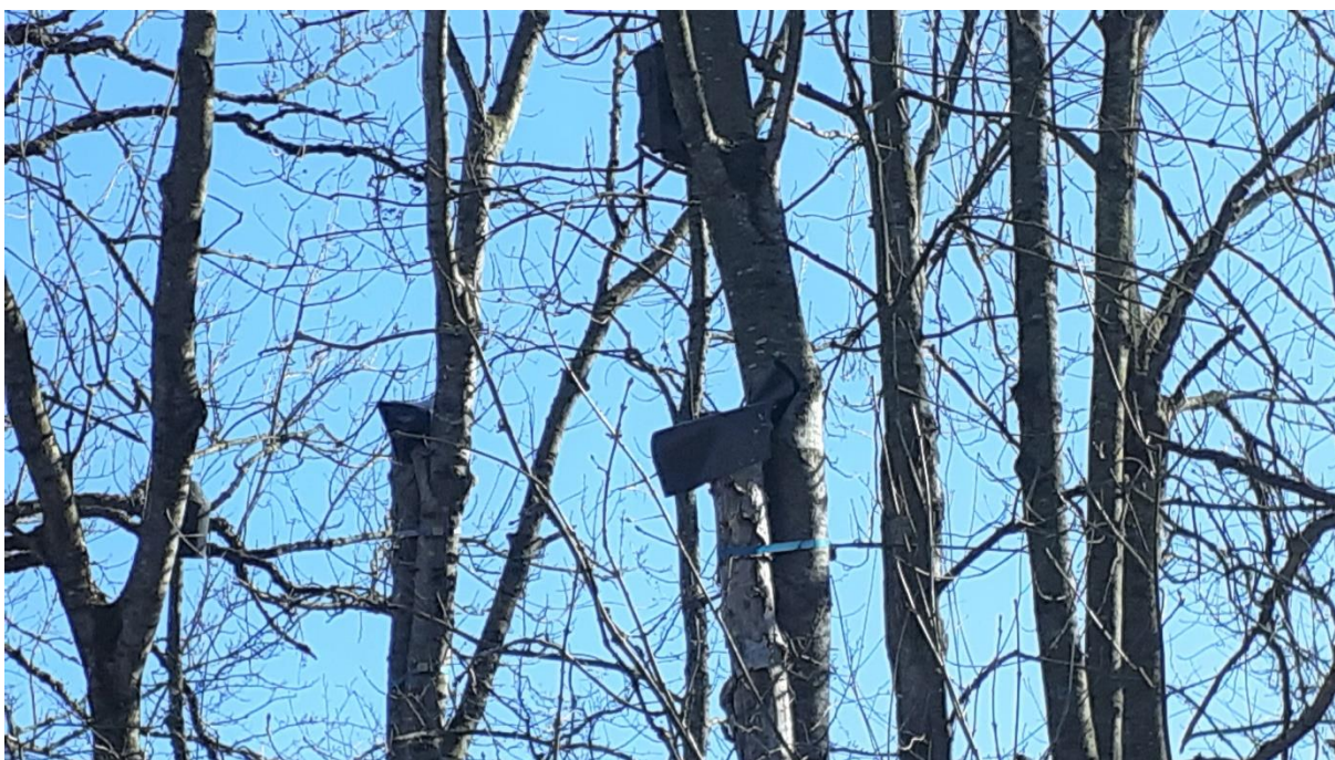
An stehenden Bäumen befestigte Stammstücke mit Habitaten, oben mit Dachpappe abgedeckt (wiederum rechts = östlich des Ludwigskanals)