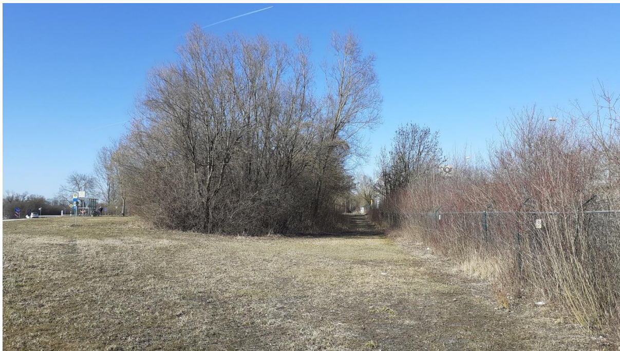
Hecke zwischen Freisinger Allee und Postverteilzentrum (Eingrünung rechts im Bild, Blickrichtung Nord).