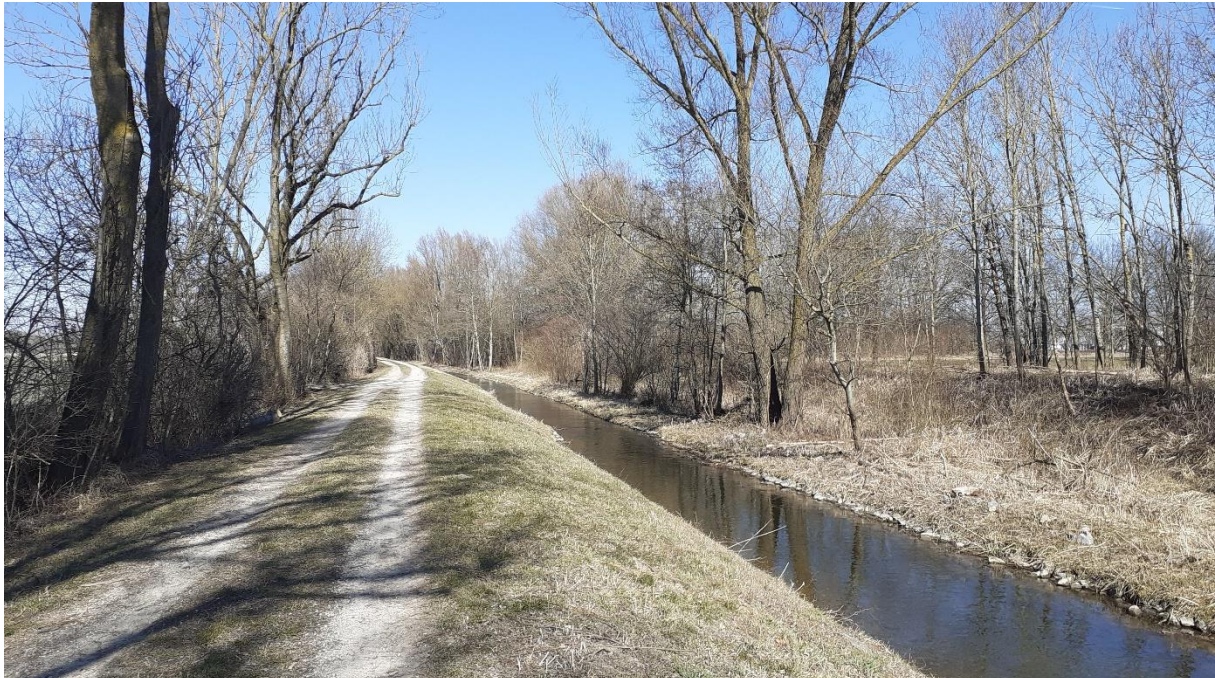
Ludwigskanal (südlich FS Allee) von S nach N: rechts Uferberme / Grabentaschen mit lückigem Gehölz B112-WN00BK, links vom Feldweg Feldhecke B112-WH00BK