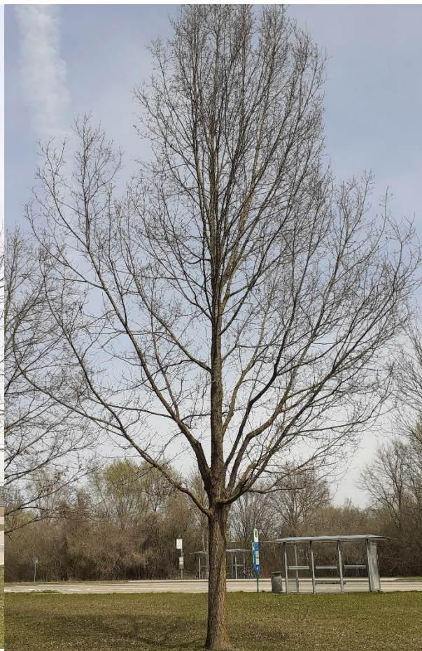
Baum Nr. 218: Stieleiche