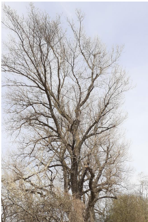
Baum Nr. 480: Pappel