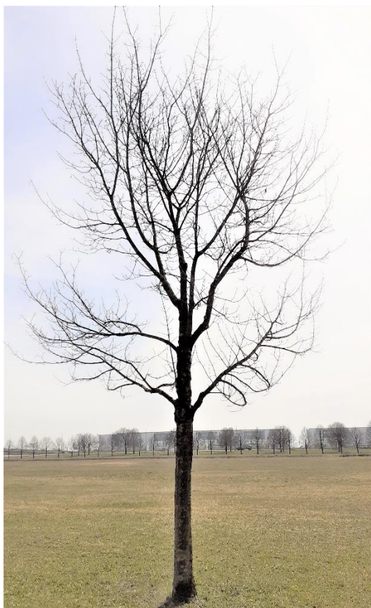
Baum Nr. 219: Bergahorn