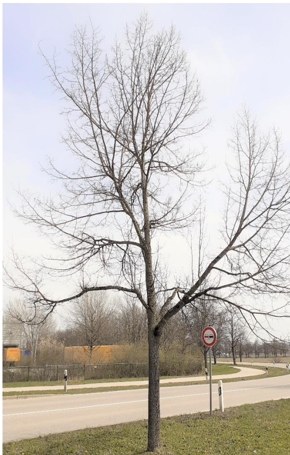
Baum Nr. 215: Winterlinde