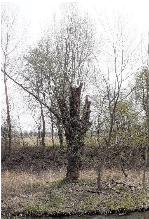
Baum Nr. 619: Silberweide als Kopfbaum beschnitten