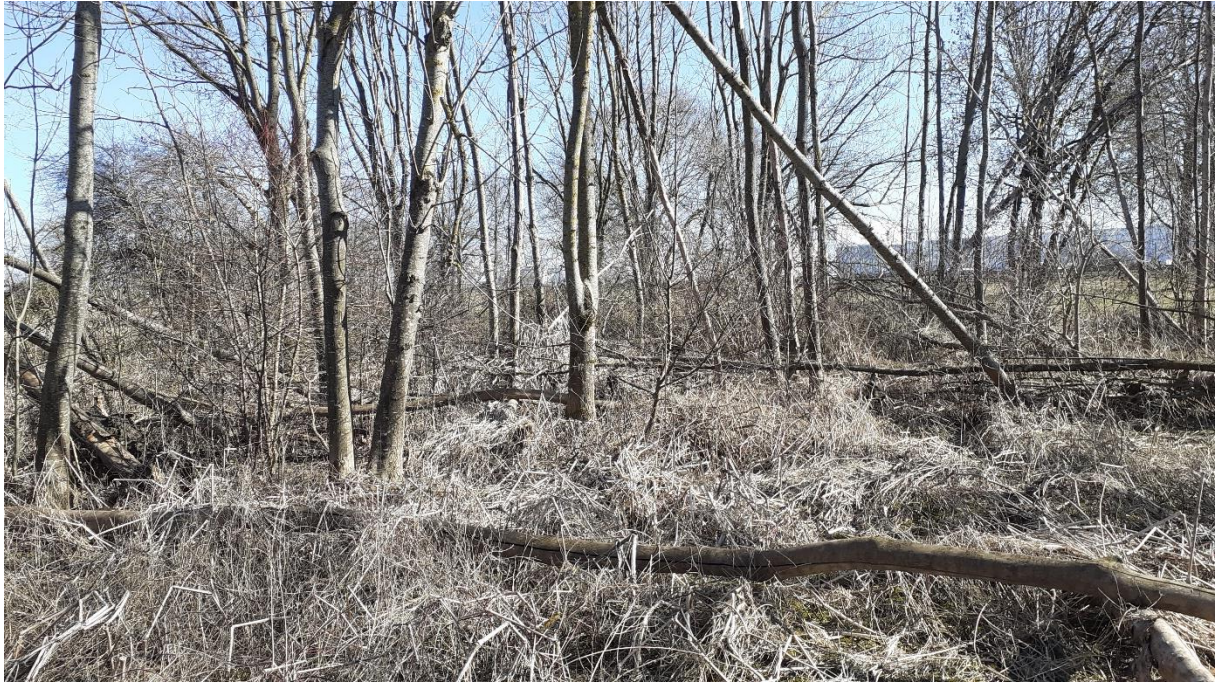
Südliches Feldgehölz, rechts des Ludwigskanals, mit hohem Totholzanteil