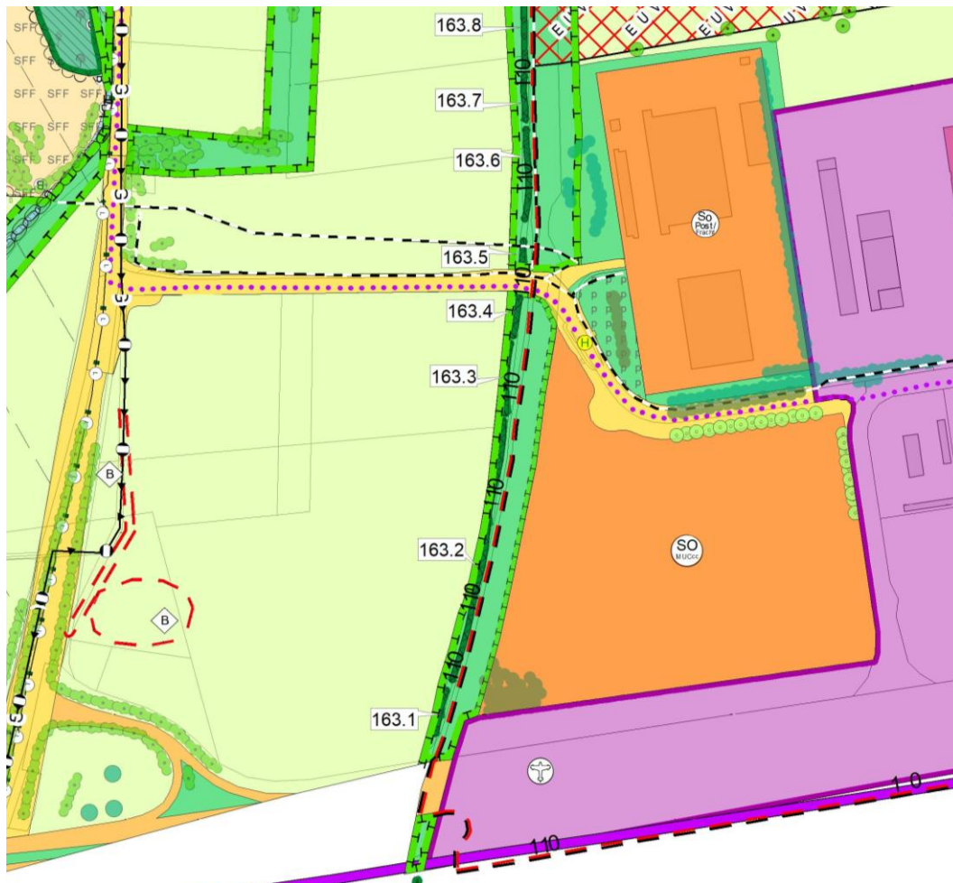
Abb.2: Planzeichnung der Flächennutzungsplanänderung (Stand Dezember 2025)