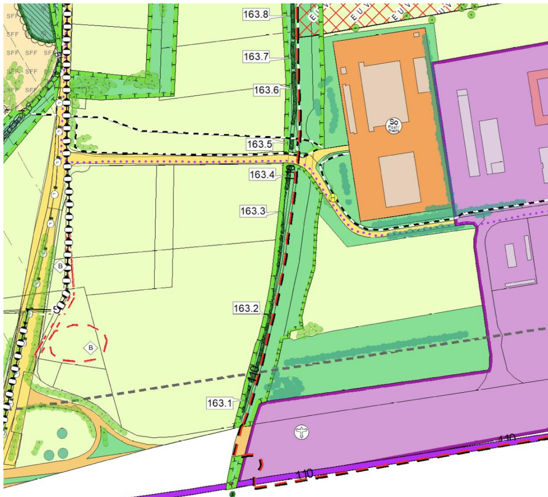
Abb. 1: Ausschnitt des rechtskräftigen Flächennutzungsplans der Stadt Freising (Stand 15.09.1998, in informeller digitalisierter Fassung vom 01.06.2005)

nach BaySIS bereits an der B301. Für die südlich des Vorhabengrundstücks verlaufende Zentralallee existiert keine Bauverbots/Baubeschränkungszone.