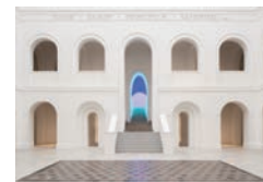
© James Turrell

Für eine individuelle Buchung im Rahmen einer exklusiven, halbstündigen Sonderöffnung wenden Sie sich bitte an kunstvermittlung@dimu-freising.de (Gebühr € 50,- pro Buchung)