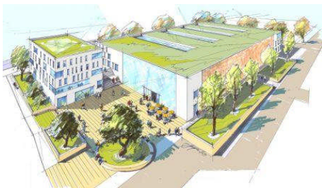
„SteinCenter“ mit Quartiersplatz

Neben dem modernen Einkaufs- und Dienstleistungszentrum, welches unter anderem einen Supermarkt, einen Discounter sowie einen Drogeriemarkt beinhalten wird, entsteht zeitgleich ein Quartiersplatz, der sowohl den Kunden des Einkaufszentrums als auch den zukünftigen Bewohnern des neuen Wohngebiets zur Verfügung stehen wird.