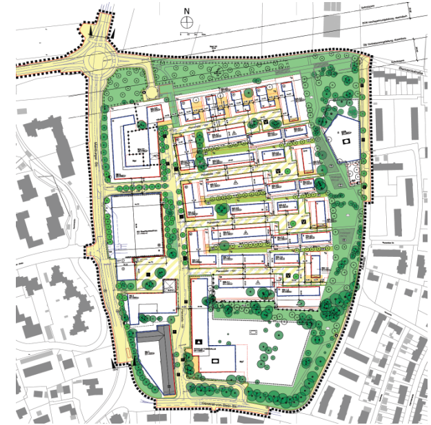
Bebauungsplan Nr. 144 „General-von-Stein-Kaserne“

Mit der Aufstellung des Bebauungsplans Nr. 144 „General-von-Stein-Kaserne“, der mittlerweile als Satzung beschlossen ist, liegt nun die Voraussetzung vor, die geplante Bebauung in die Realität umzusetzen.